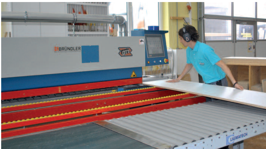
Die Schreinerei Duss setzt auf eine moderne Produktionstechnik.