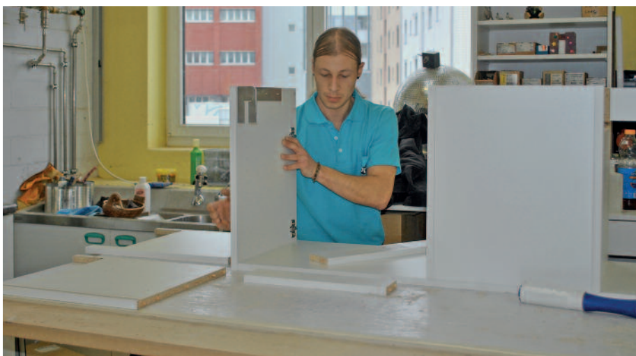
In der Schreinerei Duss sind die Mitarbeitenden für alle einzelnen Produktionsschritte verantwortlich, von der Holzwerkstoffbearbeitung bis zur Montage.