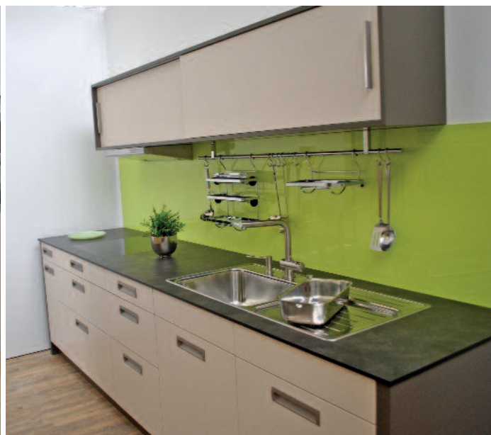
Verschiedene Küchenmodelle aus der Ausstellung der Schreinerei Duss in Emmenbrücke.