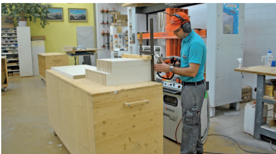
Die Produktion der Schreinerei Duss: Massarbeit ist hier Norm.

talstellung von der Werkzeugachse aus gemessen einen schlanken Abstand zur Unterkante des Aggregates von nur 35 Millimetern, damit seien die maximale Zugänglichkeit und schnelle Bewegungsabläufe für die Flachteilebearbeitung gewährleistet. Alle Werkzeuge könnten über das Hauptfräsaggregat eingesetzt werden, Winkel- und Gehrungsschnitte mit grossen Sägeblättern, Zapfen und Schlitzte mit schweren Hobelköpfen, Eckenausklinken mit spitzen Fräsern und viel mehr könnte umgesetzt werden, und das mit einer einfachsten Programmierung. Es ist sogar möglich, die Oberflächen so zu bearbeiten, dass sie eine Pinselstrichstruktur aufweisen. Crashfahrten gebe es keine.