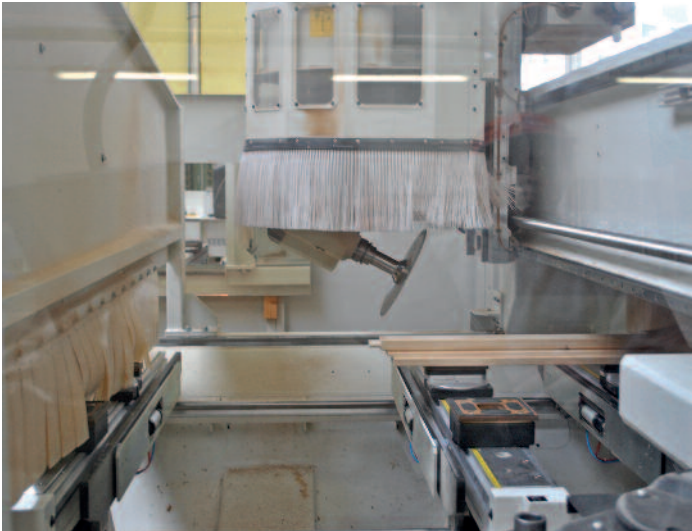
Beim 5-Achs-CNC-Bearbeitungszentrum von Morbidelli dreht das ganze Aggregat und nicht nur ein Vektorgetriebe.