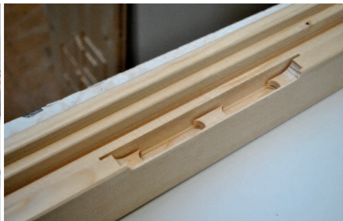
Die 5-Achs-CNC-Anlage bearbeitet Werkstücke sehr genau.