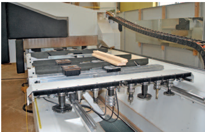
Weniger Werkzeuge dank der 5-Achs-Bearbeitung.