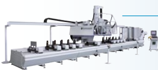
TITAN CNC-Bearbeitungszentrum. 5 Achsen – auch für Voll-Stahlprofile