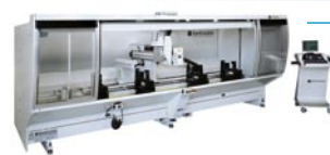
DALI CNC-Bearbeitungszentrum. 4-Achsen – Aluminium/Stahl