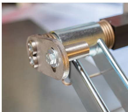
Suva-zertifizierte Höhenbegrenzung der Schutzhaube