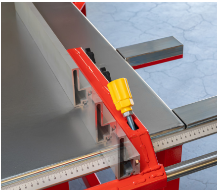
Präziser Parallelanschlag, stufenlos längs verstellbar

Die Bründler BKS swiss 100 bietet 100% Schweizer-Standard, ist Suva-zertifiziert, bedienungsfreundlich, langlebig und zuverlässig.