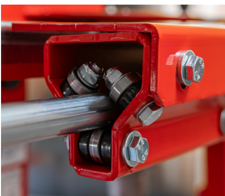
Hartverchromte Vollstahlführungen, kugelgelagert und schmutzgeschützt