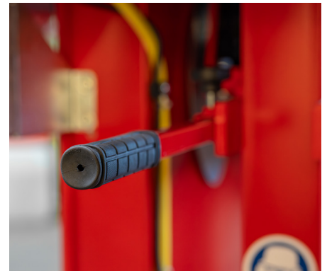
Bedienungsfreundliche Höhenverstellung des Sägeblatts