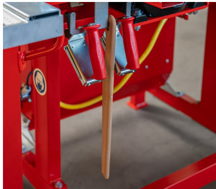
Schiebestock und zwei Suva Handgriffe für Stosshölzer